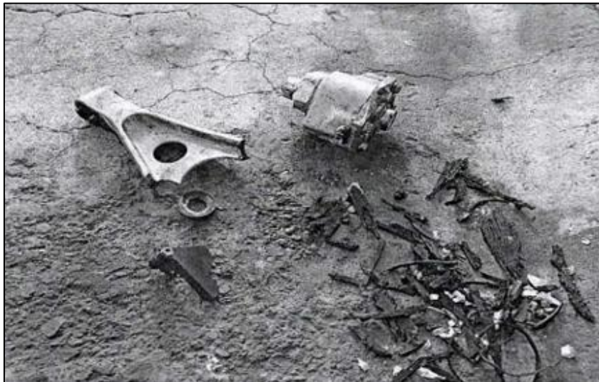
Figura 4 – Partes encontradas en la pista referente al tren principal izquierdo.