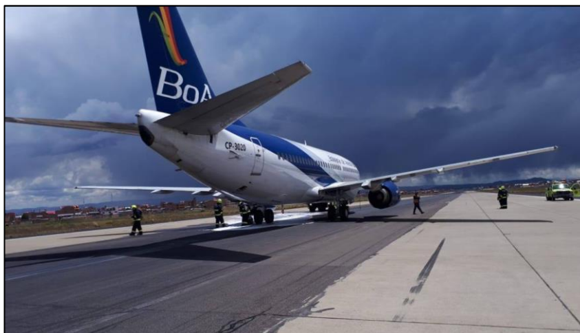
Figura 1 –Parada total y la llegada de los servicios de emergencia.

Ante esta situación, la tripulación detuvo la aeronave sobre la pista y solicitó asistencia a los servicios de emergencia del aeródromo, así como al personal de mantenimiento, como se muestra en la figura 1.