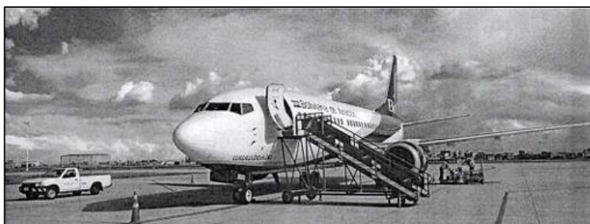
Figura 2 – Aeronave estacionada en una plataforma remota después del incidente.

Posteriormente, la aeronave fue retirada de la pista y trasladada a una plataforma remota para su evaluación técnica y acciones de mantenimiento correspondientes, como se muestra en la figura 2.