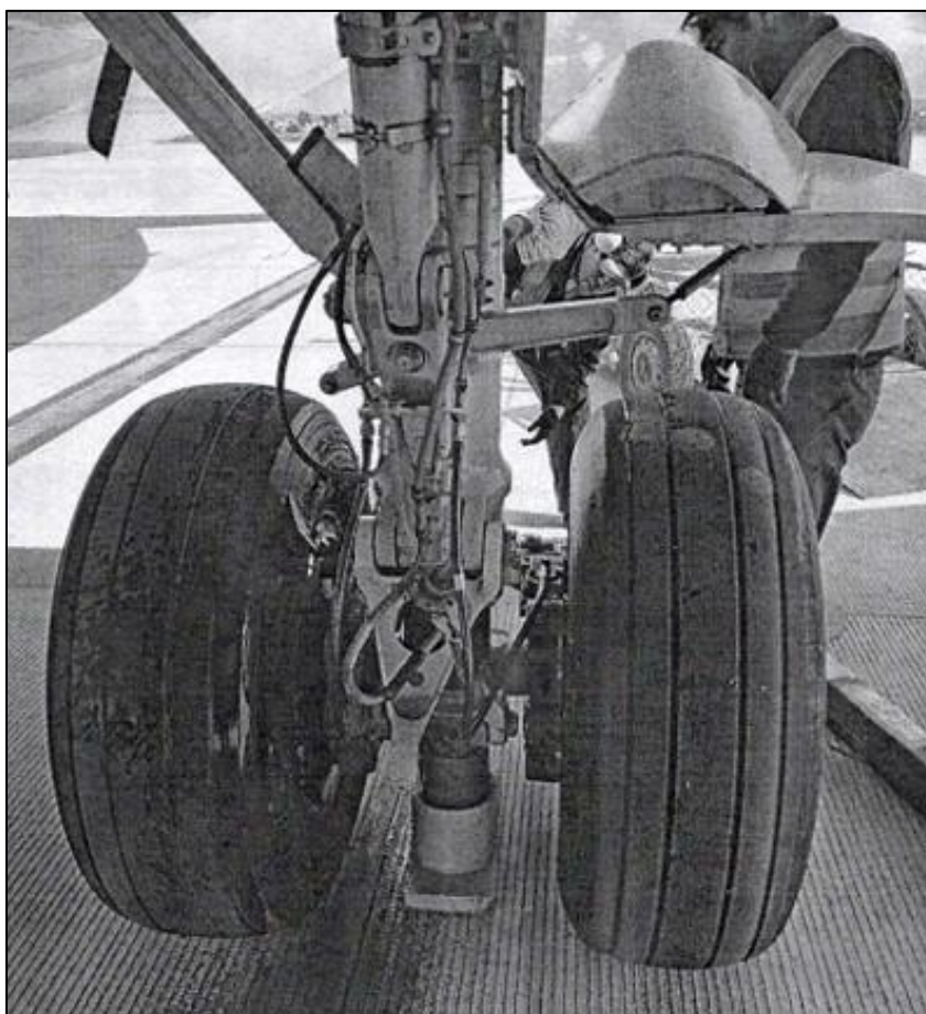
Figura 3 – Tren principal izquierdo, vista de frente.

La aeronave sufrió daños menores. Los daños estuvieron restringidos al sistema del tren de aterrizaje principal izquierdo, específicamente al componente shimmy damper , al torsion link , así como al conjunto de ruedas y neumáticos asociados (Figuras 03 y 04).